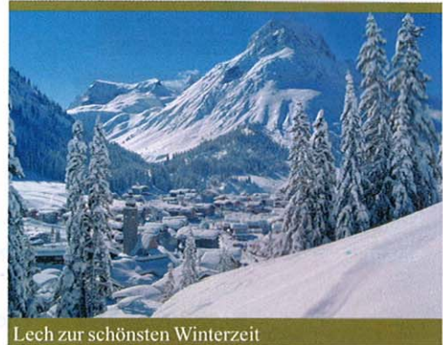
Lech zur schönsten Winterzeit