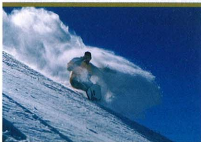
Snowboardparadies Lech am Vorarlberg

Chancenorientierte Kunden entscheiden sich bei BF für die fondsgebundene Versicherung der VLV. Neben bedarfsgerecht gestaltbarer Absicherung und flexibel wählbarem Auszahlungszeitpunkt hebt sich die Fondspolizze vor allem mittels des exklusiven